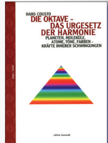
144 Seiten, paperback Bestellnr.: 01001

Es werden Anwendungsmöglichkeiten zur Harmonisierung des Lebens gezeigt, zur Stimulierung der Sinne, zu meditativer Entspannung und auch zu lustvoller Erotik. Mit Tafeln zur Tonpunktur mit Stimmgabeln.