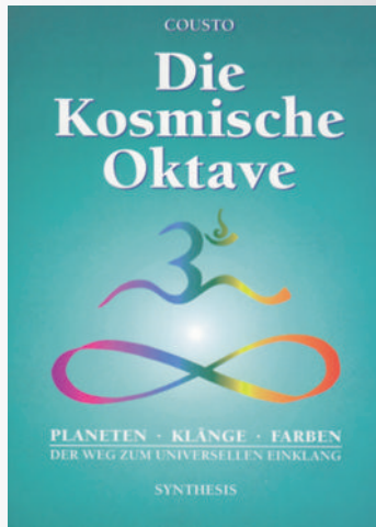
224 Seiten, paperback Bestellnr.: 02001

Beschreibungen von harmonikalen Zusammenhängen zwischen Wissenschaft und Kunst und ein ausführlicher wissenschaftlicher Anhang runden das Werk ab.